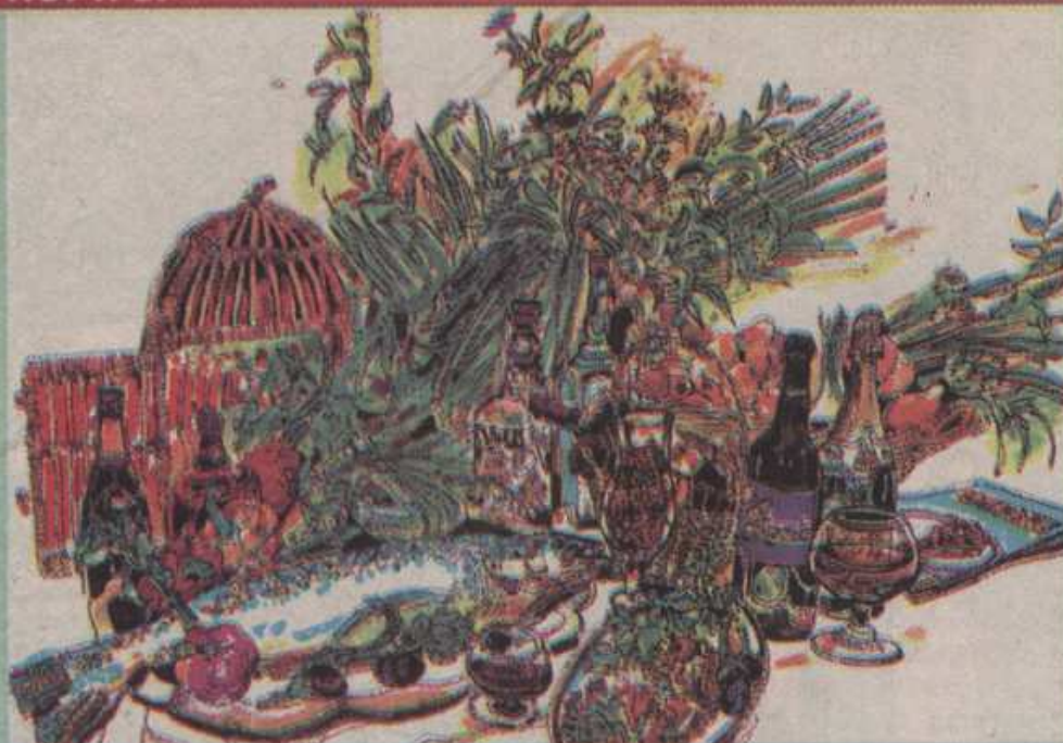
Реклама для парижского ресторана